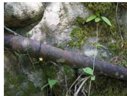
Man kan hitta rester av det avancerade bevattningssystem som Hilma anlade.