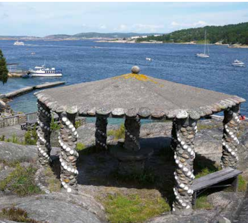
Vindarnas tempel. Kanske den mest spektakulära byggnaden på Alaska.