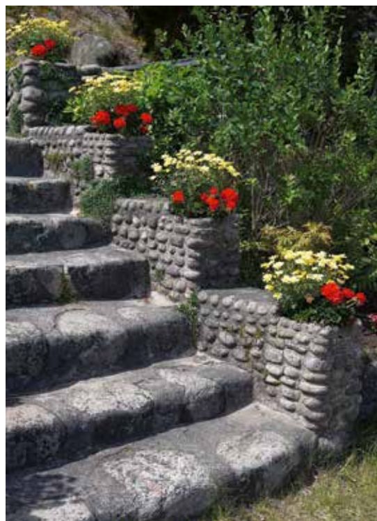
En av flera trappor. Trädgården var färdig 1930 och alltför förbipasserande båtar lade då till och besökte Hilmas oas.