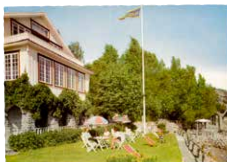
Värdshuset Golden Inn, som det såg ut innan det brann ner 1962.