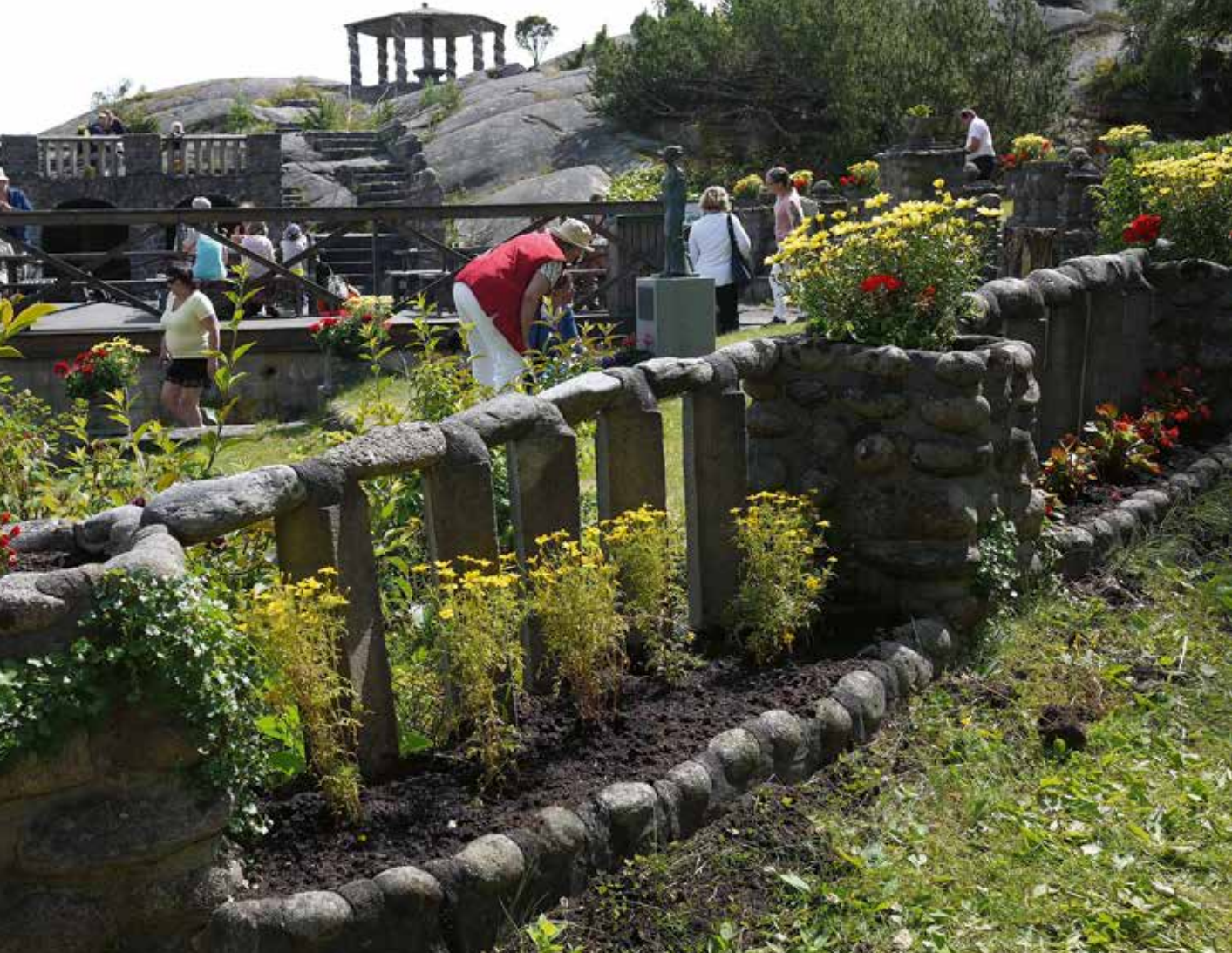
Alaska är ett populärt utflyktsmål.