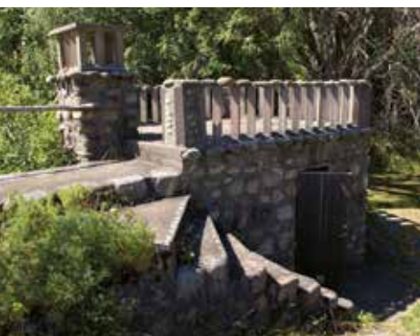
Hilmas första byggnadsverk.