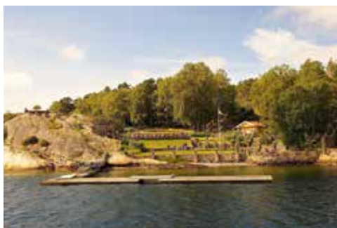
Alaska på Nord-Långö nås med båt från Strömstad.