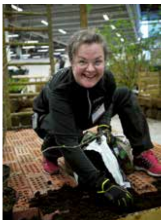
My Selander bygger golvet under pergolan.