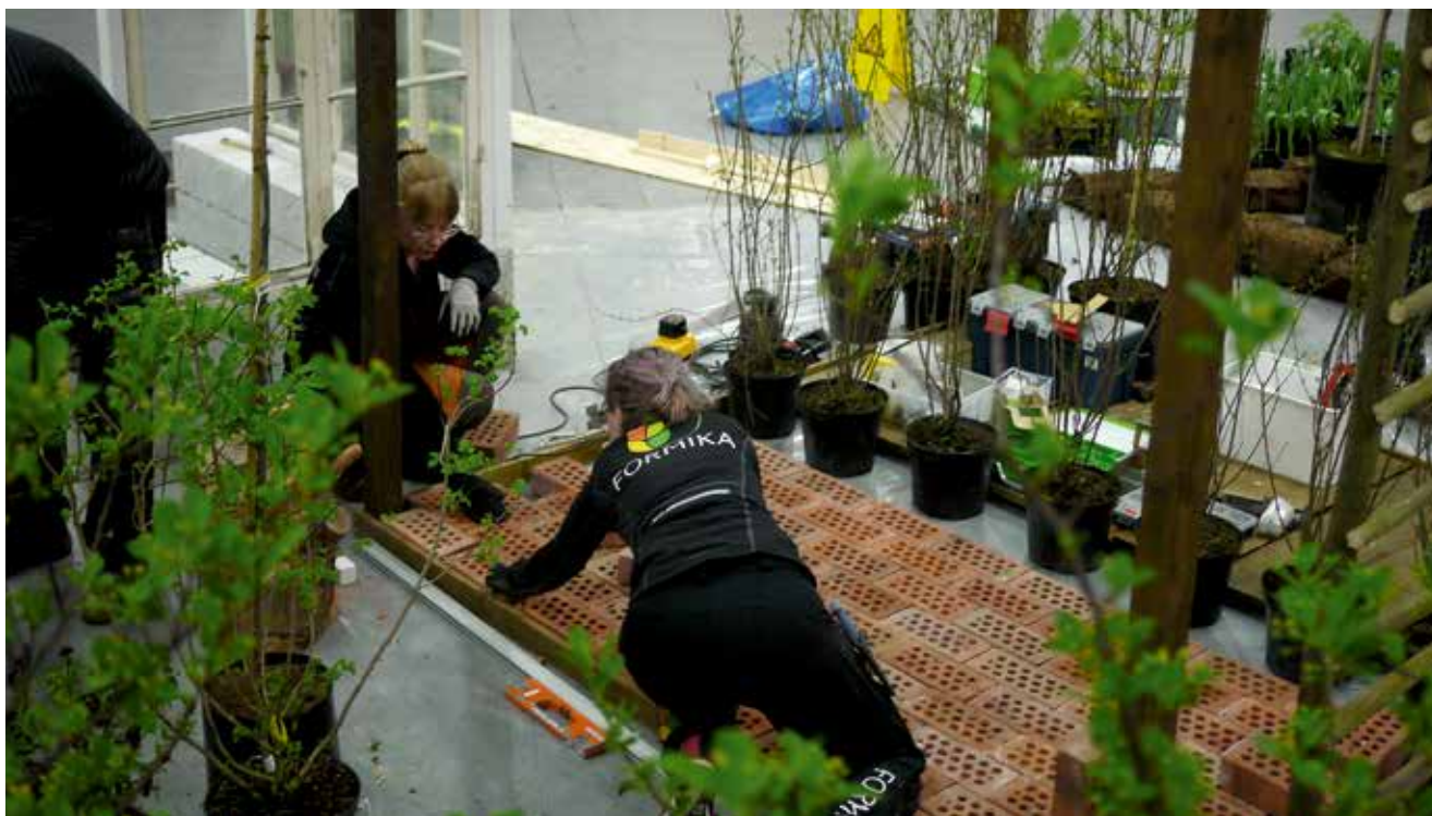
Golv av tegel läggs på plats i montern.