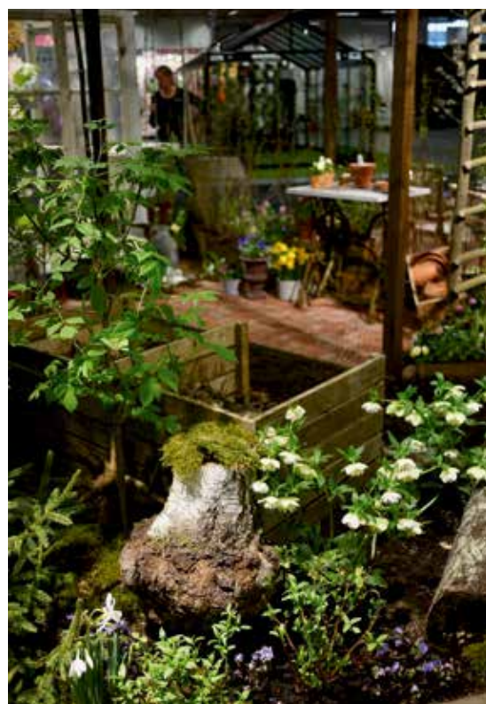
Skogsbrynet, med komposten i bakgrunden.