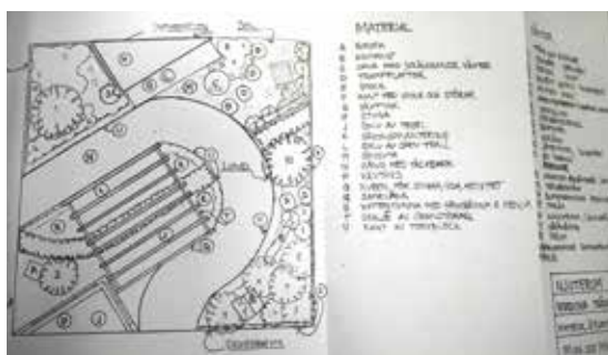
Material- och planteringsplan.